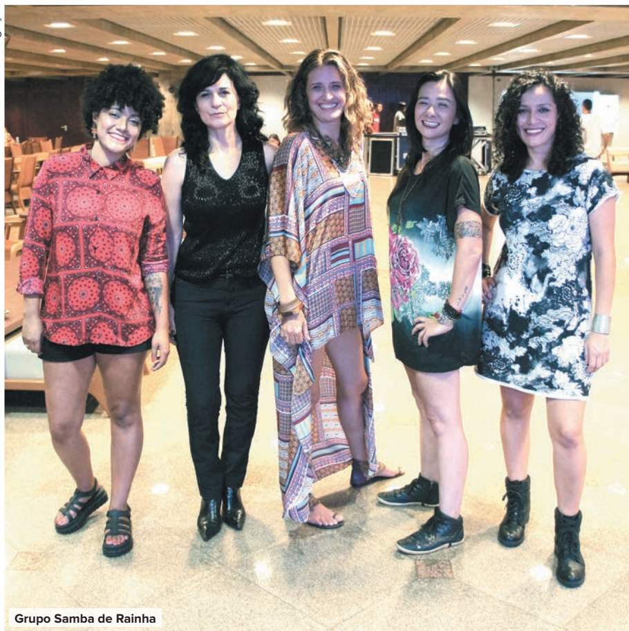
Grupo Samba de Rainha