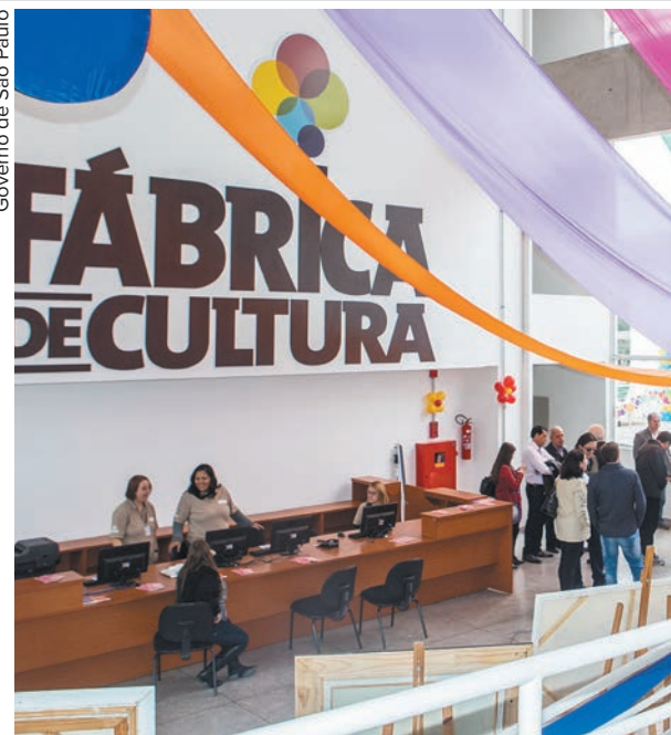
Governo de São Paulo

bre os estúdios podem ser obtidas por meio do telefone de cada unidade. Cinco unidades são gerenciadas pelo Instituto de Apoio à Cultura, à Língua e à Ligeratura (Poiesis), que são as localizadas no Jaçanã, Brasilândia, Capão Redondo, Vila Nova Cachoeirinha e Jardim São Luís, nas zonas norte e sul. Outros cinco espaços (Vila Curuçá, Sapopemba, Itaim Paulista, Parque Belém e Cidade Tiradentes), na zona leste, estão sob a administração da Organização Social de Cultura Catavento.