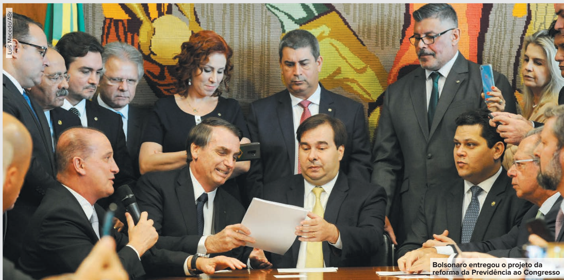
Bolsonaro entregou o projeto da reforma da Previdência ao Congresso

Terminais de ônibus da capital terão vacinação contra a febre amarela