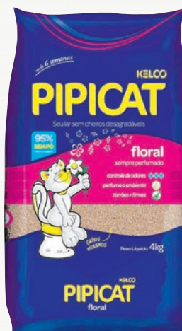
Areia higiênica para gatos Pipicat 4 kg