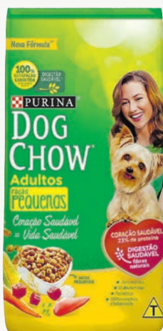
Alimento para cães adultos Dog Chow vários sabores 1 kg