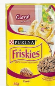
Alimento úmido para gatos Friskies 85 g