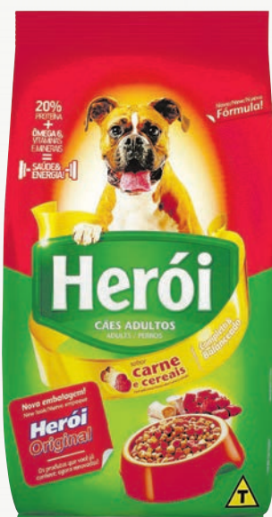
Alimento para cães Herói Original vários sabores 8 kg