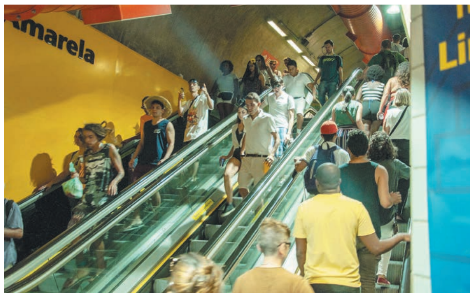
Lucas Antonio França/AE

Militar, a estação Armênia da Linha 1-Azul ficará fechada das 10h às 20h nos dias 4 e 5, para manter a segurança dos passageiros e do sistema operacional. Nos demais horários – entre 4h40 e 10h e das 20h às 0h, a estação estará aberta.