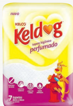
Tapete perfumado Keldog Kelco com 7 unidades