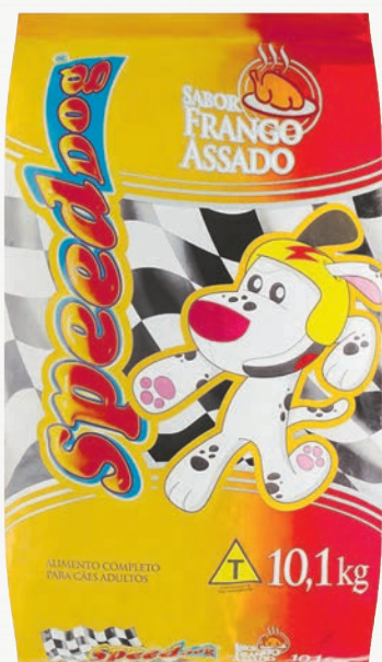
Alimento para cães Speed Dog frango assado 10,1 kg