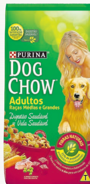
Alimento para cães adultos Dog Chow raças pequenas ou médias e grandes 10,1 kg