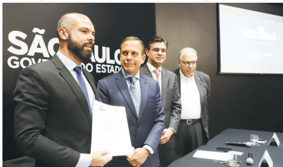
Governo de São Paulo

Ele frisou que a proposta não prevê a cobrança de pedágios, e sim que o futuro concessionário seja remunerado diretamente pelo poder público. “A concessão das marginais será uma vitrine para o Brasil todo”, afirmou.