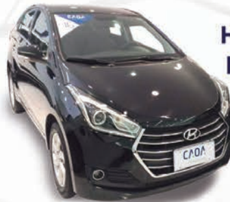
HB20 S 1.6 PREMIUM