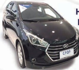
HB20 S 1.6 PREMIUM