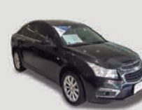
CRUZER 1.8 LT