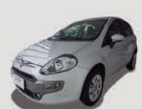
PUNTO ESSENCE 1.6