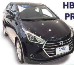
HB20 S 1.6 PREMIUM