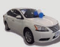
SENTRA SV 2.0