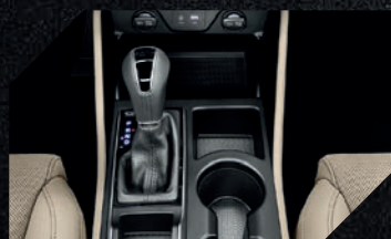
Transmissão com dupla embreagem de 7 velocidades