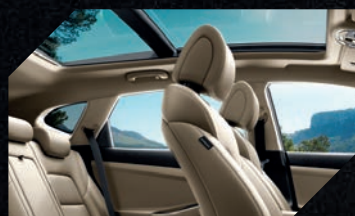
Teto solar panorâmico