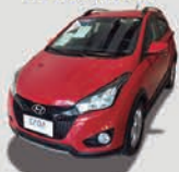
HB20X 1.6 COMFORT STYLE 16V AUTOMÁTICA