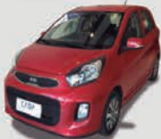
KIA PICANTO 1.0 12V FLEX AUTOMÁTICO