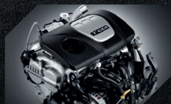
Motor Turbo GDI