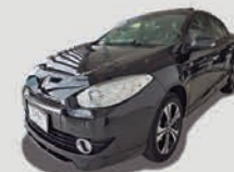
FLUENCE GT LINE 2.0 AUT