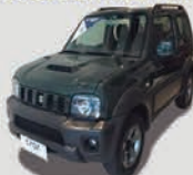
SUZUKI JIMNY 1.3 ALL 4X4 16V GASOLINA 2P MANUAL