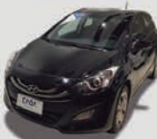
130 MPI 16V GASOLINA AUTOMÁTICO