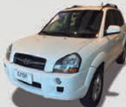
TUCSON 2.0 MPFI GLS 16V FLEX AUTOMÁTICO