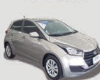
HB20 1.6 CONFORT PLUS