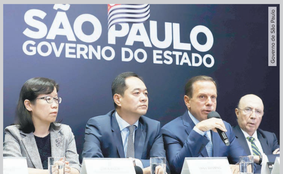
Governo de São Paulo

Economia do Metrô nos últimos 16 anos ultrapassou R$ 160 bilhões