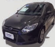
FORD FOCUS 1.6 HATCH 16V FLEX AUTOMÁTICO