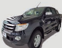
RANGER XLT 2.5 CD