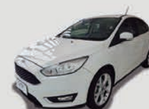
FOCUS 1.6 SE PLUS