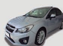
SUBARU IMPREZA 2.0