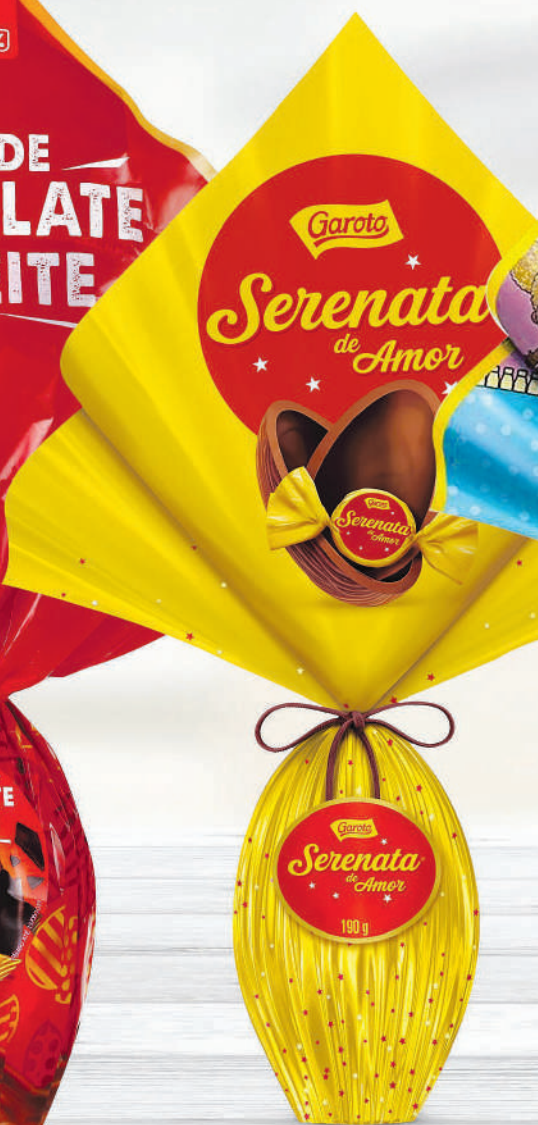
OVO DE PÁSCOA GAROTO Serenata de Amor ou L.O.L Surprise! ao Leite - 190 g/150 g