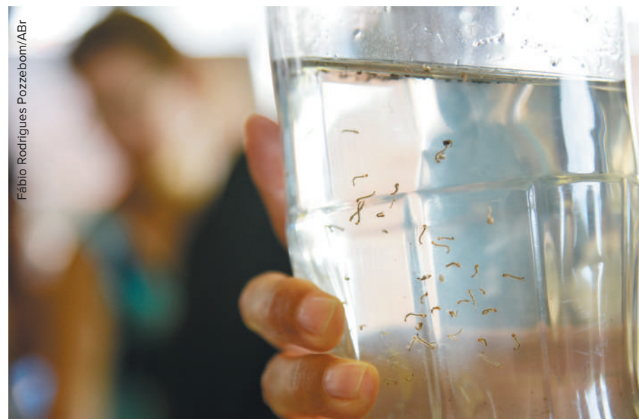
Fábio Rodrigues Pozzebom/ABr