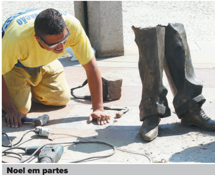
Noel em partes

A estátua do cantor e compositor Noel Rosa, em Vila Isabel, bairro na zona norte do Rio de Janeiro, teve peças roubadas mais uma vez nesta terça-feira, 16. O monumento mostra o músico sentado em um bar sendo servido por um garçom. Agora, só sobraram os pés e uma pequena parte das pernas de Noel.