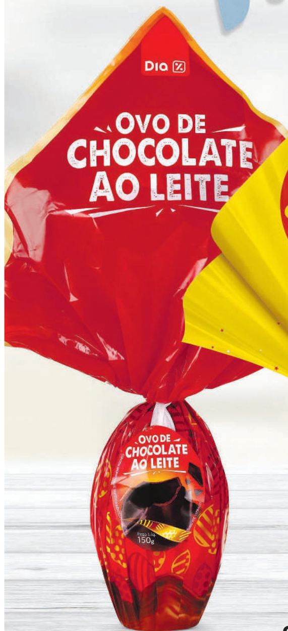
OVO DE PÁSCOA DIA ao Leite - 150 g

PÁSCOA RECHEADA DE OFERTAS BEM AQUI: DO SEU LADO.