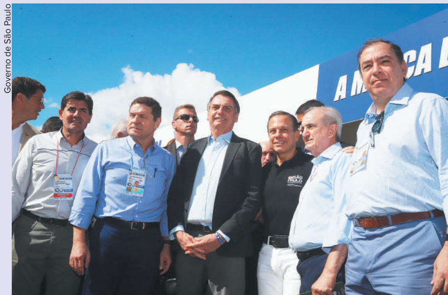
Governo de São Paulo

As empresas parceiras no projeto são a GasBrasiliense, responsável pela distribuição de gás na-