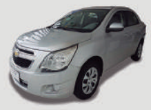
COBALT LT 1.8 AUT

ANO/MOD 2014/2015 PLACA FFK-5855 R$ 35.990