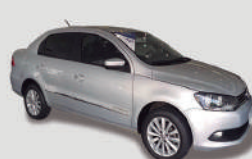
VOYAGE CL SB

ANO/MOD 2015/2016 PLACA FXB-3720 R$ 37.890