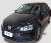
JETTA 2.0 COMF TIPTRONIC

ANO/MOD 2015/2015 PLACA FPV-6627 R$ 54.990