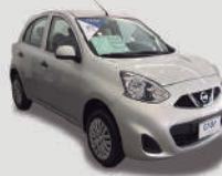
MARCH S 1.0

ANO/MOD 2018/2019 PLACA QOF-7753 R$ 36.990