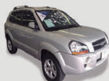
TUCSON GLS 2.0

ANO/MODELO 2015/2016 PLACA FIB-5490 R$ 45.990