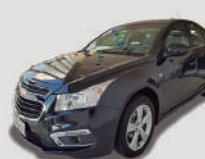
CRUZE HB LT AUTOMATICO

ANO/MOD 2014/2015 PLACA FTU-4573 R$ 52.990