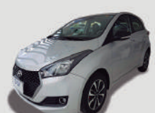
HB20 RSPEC AUT

ANO/MOD 2016/2016 PLACA FSL-3498 R$ 48.990