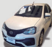
ETIOS SEDAN 1.5 X AUTO

ANO/MODELO 2018/2019 PLACA BCB-5406 R$ 52.990