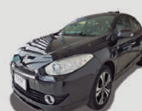
FLUENCE GT LINE 2.0 AUT

ANO/MOD 2014/2014 PLACA FTF-9361 R$ 46.990