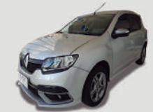
SANDERO GT LINE

ANO/MODELO 2016/2017 PLACA FTC-0687 R$ 42.990