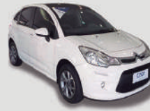
C3 TENDENCE BVA 1.6

ANO/MOD 2014/2015 PLACA FQV-3926 R$ 39.890