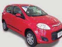
PALIO ATACTIVE 1.0

ANO/MOD 2015/2016 PLACA FNB-4421 R$ 29.890