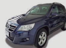
TIGUAN TSI 2.0 AUT

ANO/MOD 2011/2011 PLACA EUT-4304 R$ 45.990