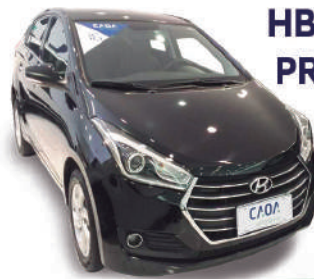
HB20 S 1.6 PREMIUM