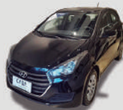
HB20 COMF PLUS 1.0

ANO/MOD 2016/2017 PLACA PYH-9498 R$ 35.990