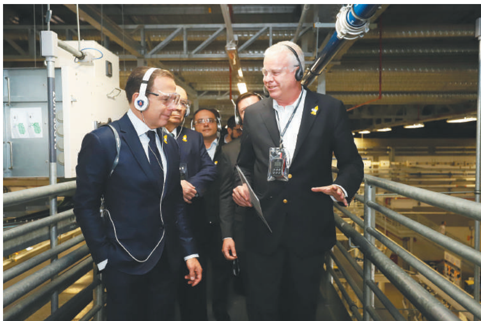
Governo de São Paulo

A Scania se candidata, se desejar participar do IncentivAuto, considerando que está fazendo um investimento de R$ 1,4 bilhão. São R$ 400 milhões a mais do limite mínimo e garantindo o mínimo de 400 novos empregos vinculadamente a esses investimentos.