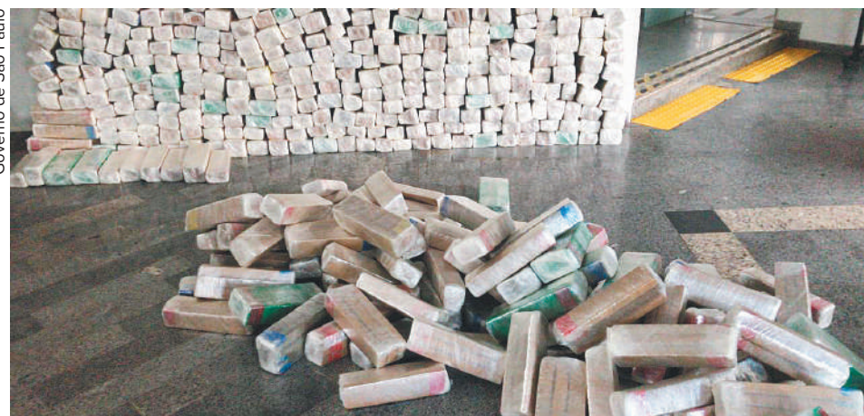
Governo de São Paulo

apreendidos estão 10,6 toneladas de cocaína, que representa mais de 25% do total. Por ser uma droga cara, que gera grande lucro para os criminosos, o impacto das apreensões é um significativo golpe financeiro nas facções responsáveis pelo tráfico. Só na