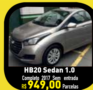
HB20 Sedan 1.0 Completo 2017 Sem entrada R$ 949,00 Parcelas