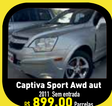
Captiva Sport Awd aut 2011 Sem entrada R$ 899,00 Parcelas