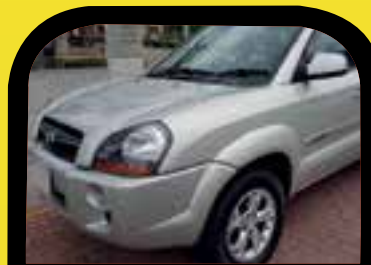
Tucson GLS Aut 2010 Peg entrada R$ 799,00 Parcelas