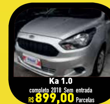
Ka 1.0 completo 2018 Sem entrada R$ 899,00 Parcelas