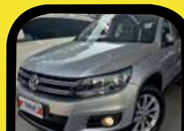
Tiguan 2.0 tsi aut 2012 R$ 52.900,00