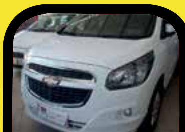
Spin LTZ 7 LUGARES 2014 Sem entrada R$ 1.099,00 Parcelas

Somar, a loja que mais vende para aplicativos em SP.