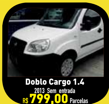
Doblo Cargo 1.4 2013 Sem entrada R$ 799,00 Parcelas