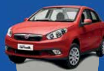
GRAND SIENA 1.0 COMPLETO 2019 A PARTIR DE R$ 42.990 19/19

GRATIS KIT PACK CONVENIENCE E ATÉ 8.000 DE BONUS NO SEU USADO NA TROCA