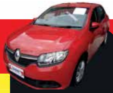
Logan 1.0 flex 2016 Sem entrada R$ 799,00 Parcelas