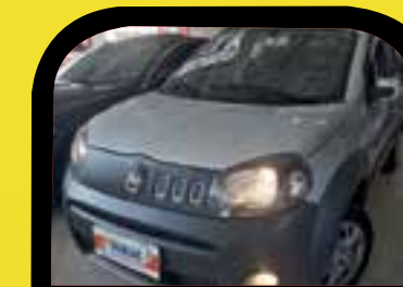
Uno way 1.0 2012 Sem entrada R$ 549,00 Parcelas