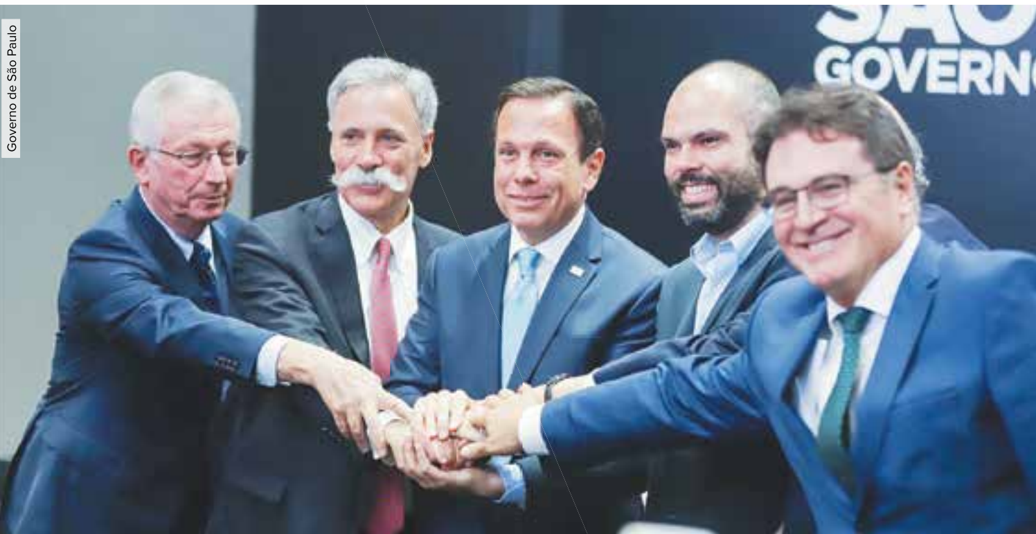
Governo de São Paulo