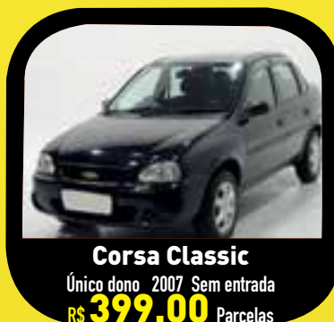
Corsa Classic Único dono 2007 Sem entrada R$ 399,00 Parcelas