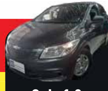
Onix 1.0 Completo 2018 Sem entrada R$ 949,00 Parcelas

Credibilidade e seriedade é a nossa marca.