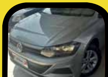
Polo 1.0 Completo 2019 Sem entrada R$ 1.199,00 Parcelas