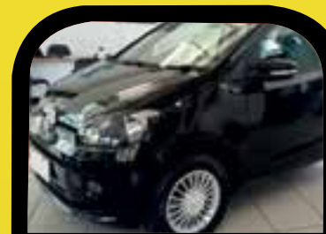
Up TSI 2016 Sem entrada R$ 999,00 Parcelas