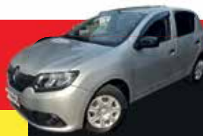
Sandero 1.0 flex completo 2015 Sem entrada R$ 799,00 Parcelas