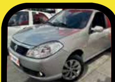
Symbol 1.6 completo 2011 Sem entrada R$ 599,00 Parcelas