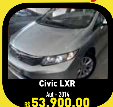
Civic LXR Aut - 2014 R$ 53.900,00