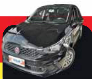
Argo Drive flex Completo 2018 Sem entrada R$ 1.049,00 Parcela