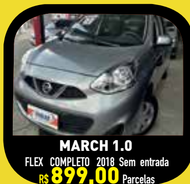
MARCH 1.0 FLEX COMPLETO 2018 Sem entrada R$ 899,00 Parcelas