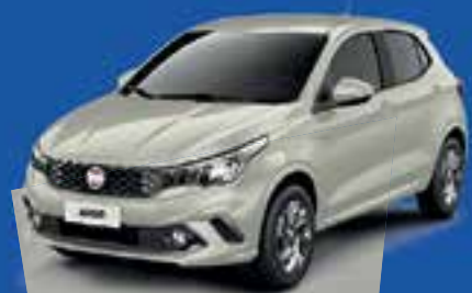
ARGO DRIVE 1.0 COMPLETO 2019 A PARTIR DE R$ 46.990 a vista