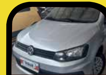
Voyage 1.6 completo 2018 Sem entrada R$ 999,00 Parcelas

Equipe de vendas preparadas com longa experiência para oferecer o melhor negócio aos nossos clientes!