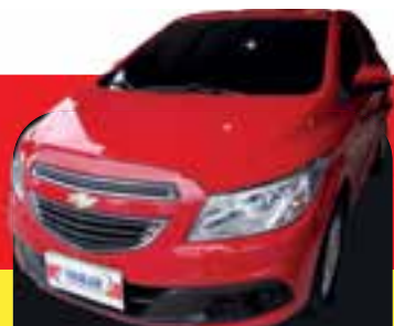
Prisma 1.0 flex completo 2018 Sem entrada R$ 999,00 Parcelas