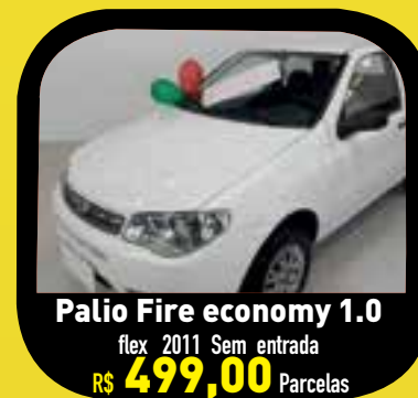
Palio Fire economy 1.0 flex 2011 Sem entrada R$ 499,00 Parcelas

Estamos localizados em 4 pontos de vendas, oferecendo comodidade e agilidade para receber nossos clientes: