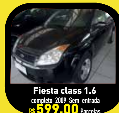
Fiesta class 1.6 completo 2009 Sem entrada R$ 599,00 Parcelas