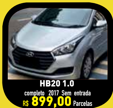
HB20 1.0 completo 2017 Sem entrada R$ 899,00 Parcelas