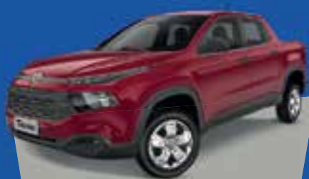
TORO ENDURENCE 1.8 2019 A PARTIR DE R$ 79.990

GRATIS KIT PACK CONVENIENCE E ATÉ 8.000 DE BONUS NO SEU USADO NA TROCA