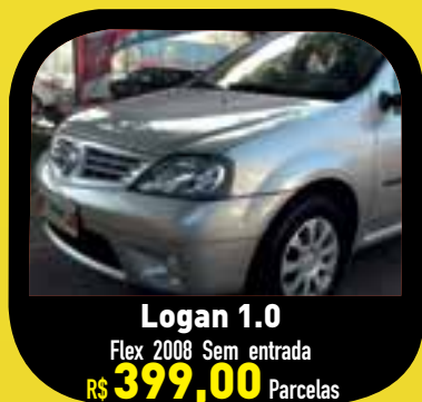
Logan 1.0 Flex 2008 Sem entrada R$ 399,00 Parcelas