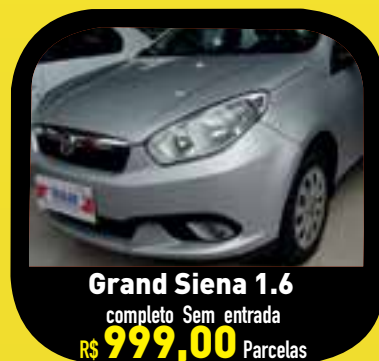
Grand Siena 1.6 completo Sem entrada R$ 999,00 Parcelas