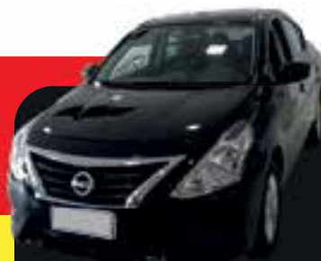
Versa 1.0 flex completo 2018 Sem entrada R$ 999,00 Parcelas