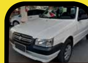
Uno Mille Economy 2012 Sem entrada R$ 399,00 Parcelas