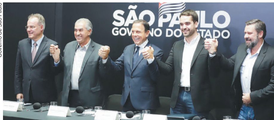
Governo de São Paulo

Também participaram do encontro o relator do projeto de lei da reforma na Câmara