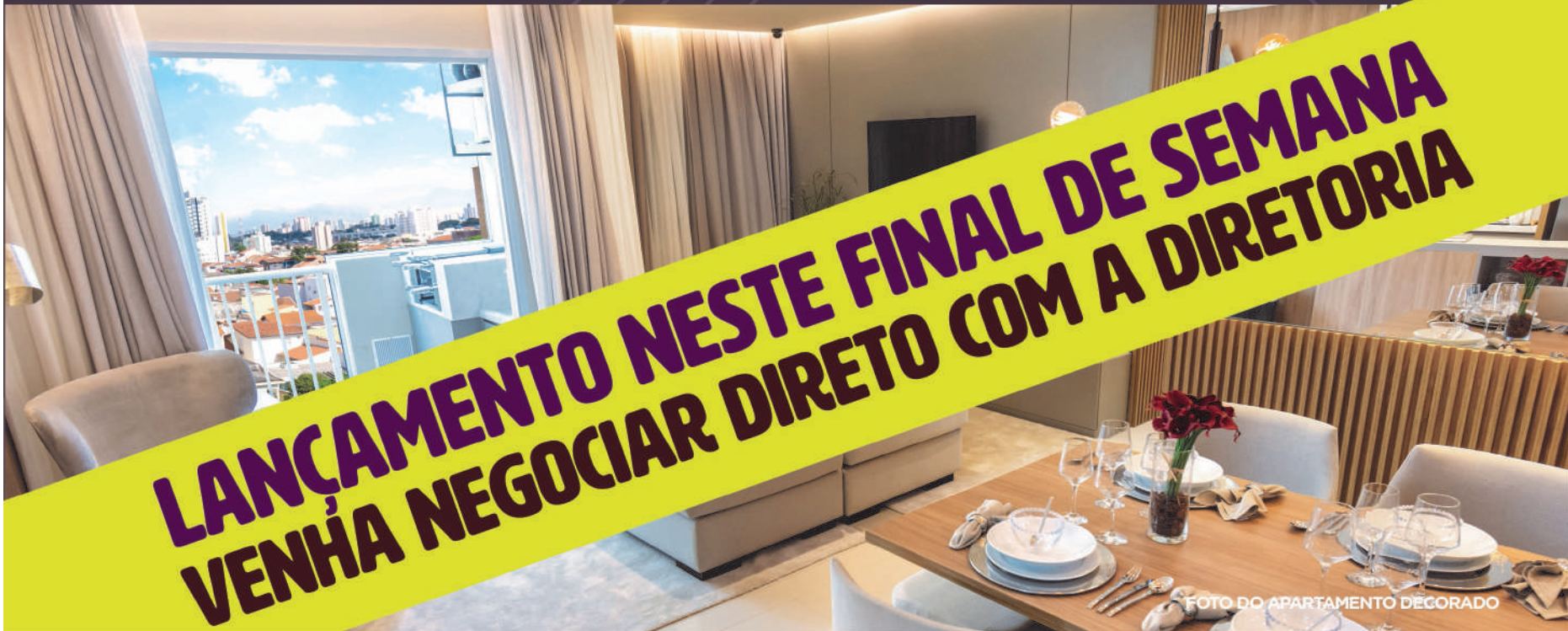
FOTO DO APARTAMENTO DECORADO

LANÇAMENTO NESTE FINAL DE SEMANA VENHA NEGOCIAR DIRETO COM A DIRETORIA