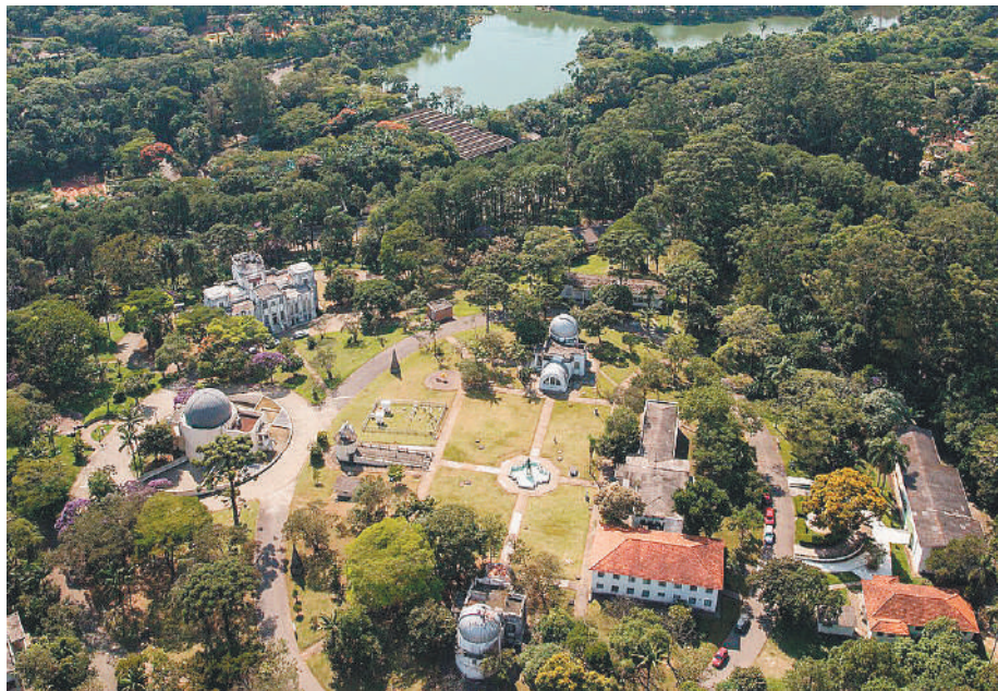
Governo de São Paulo

Por 64 votos a favor e 13 contra, a Assembleia Legislativa do Estado de São Paulo (Alesp) aprovou na noite desta terça-feira, 11, o projeto de lei do governador João Dória (PSDB) que pretende conceder o Zoológico, o Zoo Safari e o Jardim Botânico à iniciativa privada por 35 anos. A Associação de pesquisadores Científicos do Estado de São Paulo (APQC) realizou protestos no plenário contra a concessão.