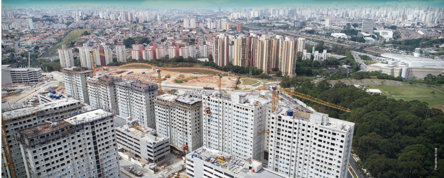
Foto aérea do local