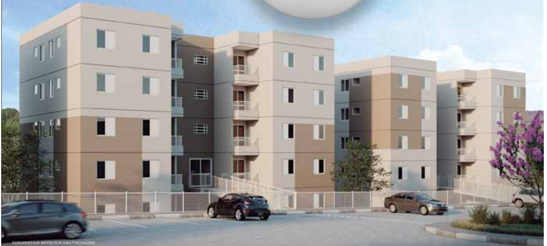
PROSPETIVA ARTÍSTICA DAS FACHADAS

PREÇO A PARTIR DE R$ 130 MIL COM TODA A DOCUMENTAÇÃO INCLUSA*