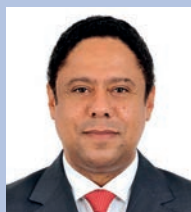
ORLANDO SILVA (PC DO B)