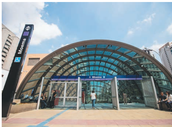
Governo de São Paulo

fatos, mas não agiu para suspender administrativamente o contrato. O promotor já havia enviado uma recomendação ao Metrô afirmando que as empresas não poderiam se manter como parte do grupo que venceu a concessão da linha, mas a recomendação não foi atendida.