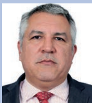
ALEXANDRE PADILHA (PT)