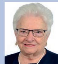
LUIZA ERUNDINA (PSOL)