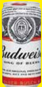
Cerveja Budweiser lata 269 ml