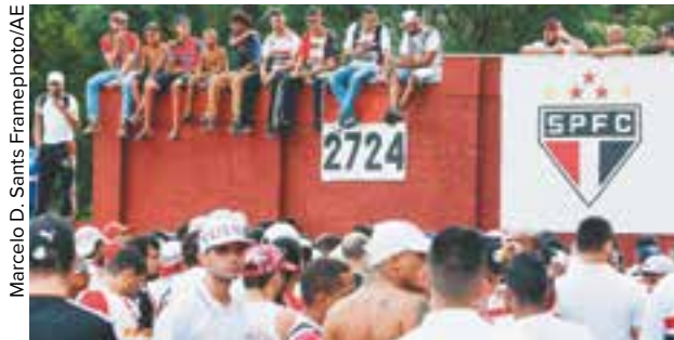
Marcelo D. Santos Framephoto/AE

A proibição é válida a partir do primeiro jogo do clube após a paralisação da Copa América. No dia 13 de julho, o São Paulo recebe o Palmeiras no Morumbi pela 10ª rodada