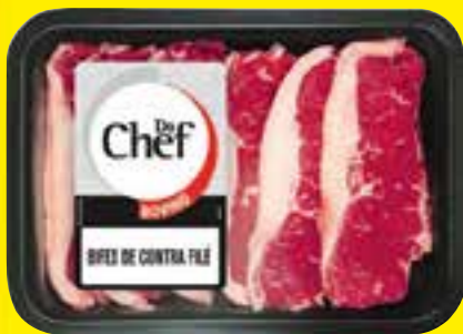
Bife de contrafilé bovino tradicional kg

TODAS AS ÁGUAS DE COCO COM 30% de desconto