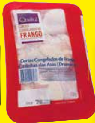
Coxinha da asa de frango Qualitá bandeja 700 g