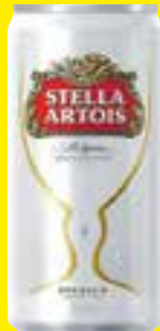
Cerveja Stella Artois lata 269 ml