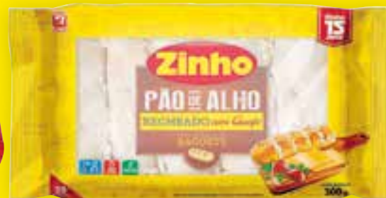
Pão de alho Zinho 300 g