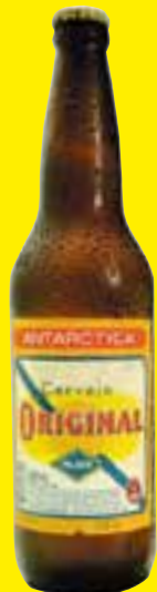
Cerveja Original garrafa 600 ml