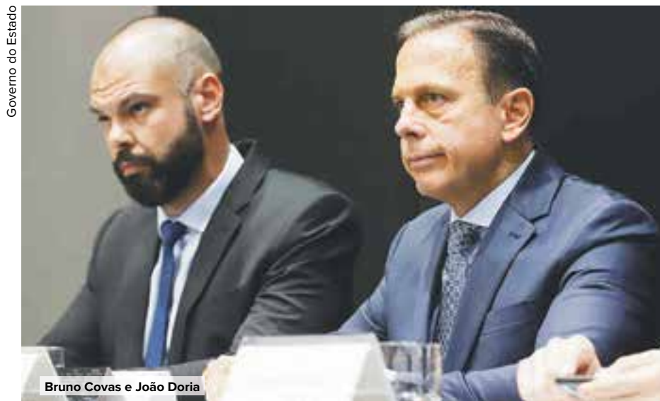
Governo do Estado