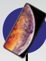
Celular super moderno