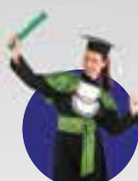
Faculdade do futuro