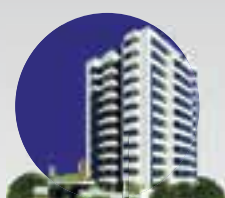
Apê dos sonhos