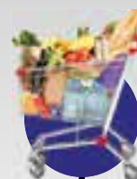
Comprinhas do dia a dia